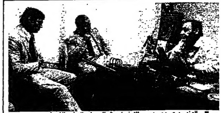
الوزير بري مع مدير الأورو، في الوسط والسفير السوري

تشكيل قوة ضاربة لإنهاء حال الحرب بدءاً من بيروت التفجيرات المتتالية بين بيروت وطرابلس والجنوب، التي يظنها البعض على مجمل الأوضاع، وعلى الأمل المحلقة على نتائج قمة دمشق، خاصة وأن الحلول المطلوبة للضيق الخيمت وجزين بدت بعد مئلا. ومع اهتمامه بمعالجة الشائعات التي انتشرت في بيروت، خصص رئيس الجمهورية السيد ميشال سنيور، تتنقح الاتصالات التي أجراها مباشرة أو عبر مؤلفين، مع القيادات اللبنانية لمواجهة المرحلة المقبلة، ووضع نتائج قمة دمشق موضع التنفيذ. كما راجع الرئيس الجليل التقارير والملاحظات التي رفعتها إليه الأجهزة المختصة التي كلفها بطورة تفصيلية المشروع الأمني - السياسي المتكامل الذي يخته مع الرئيس السوري حافظ الأسد خلال قمة دمشق، وخصوصاً ما يتعلق بمقايير رئيسين: الوقت السياسي وانتهاء حال الحرب، مع ما يستتبع ذلك من إجراءات أمنية وسياسية تؤدي إلى تنفيذ مضمون البيان الوزاري وتحقق الإصلاحات